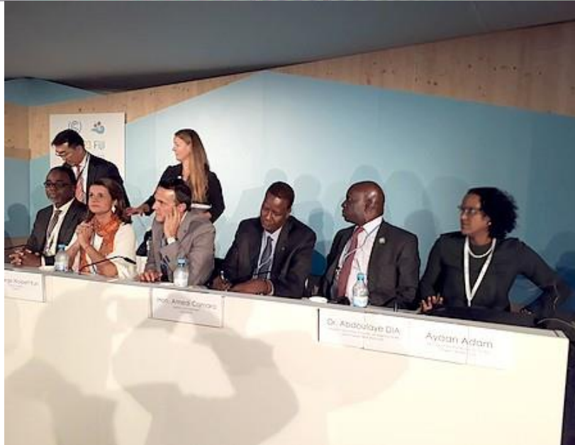
Panélistes du Side Event

Ce Side Event a permis aux Représentants de la GMV de tirer la sonnette d’alarme sur les complexités des mécanismes du Fonds vert et le faible taux de mobilisation de ces fonds par les pays du Sud et plus particulièrement leurs secteurs privés.