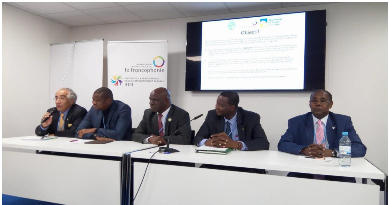
13 novembre 2017, Panélistes du Side Event APMV/OSS/IFDD