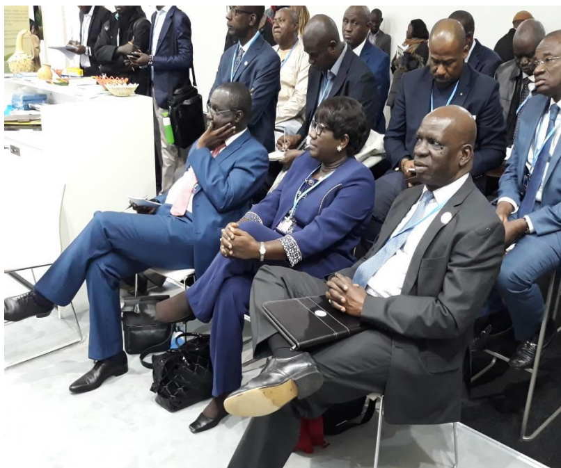
Au pavillon du Sénégal, une rencontre sur le rôle des communautés